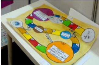
Ici au Salon du Livre 2010 où de nombreux enfants ont pu y jouer !

Un nouveau jeu pour les 8 à 12 ans, conçu pour être joué avec un accompagnateur - parent, éducateur en maison de quartier, ou les animateurs de Graines de Paix.